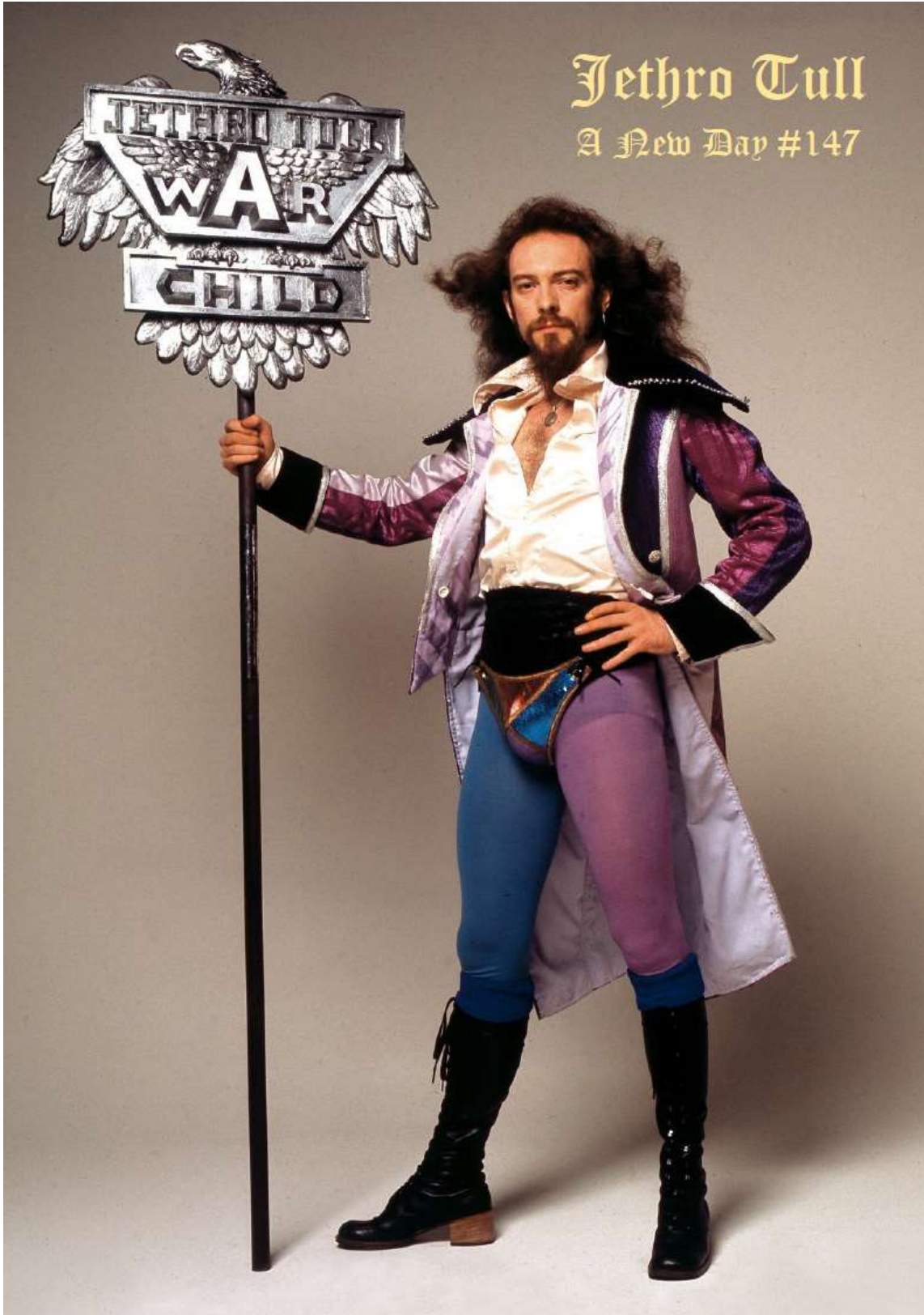
A NEW DAY REPORT #147 (Vydáno v prosinci 2023 )